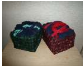
優勝カップ保管袋