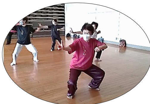
400 回で WASEDA カラーTシャツ受賞、 600 回でも好きな WASEDA カラーを希望しました