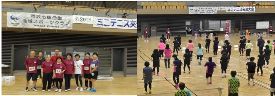
（会場での我がメンバー）

しかし今回の場合も、若手は 27 歳から最高齢者の 85 歳まで幅広い年齢層の方々でした。特にミニテニスの考案主旨は、高齢者でも気軽に楽しみながら健康を維持できるスポーツであることからして、80 歳代の方々が 6 名参加して頂いたことは、主催者として本当に嬉しい限りでした。