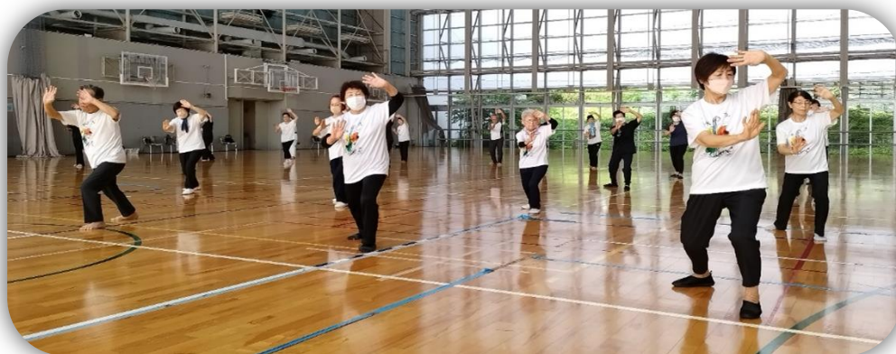
キャンパスの皆さん

休み明け9月の稽古は、各会場とも元気に集い久しぶりの稽古に汗を流し、中でも7月から夏に合った白のTシャツで稽古する仲間が増え、9月も白のTシャツを着た稽古は、まだまだ残暑厳しい中にも清々しさを感じました。