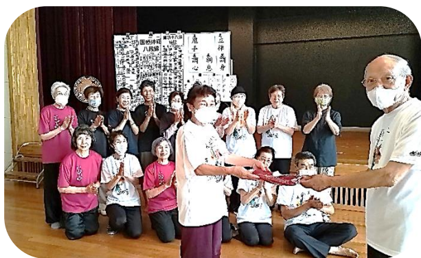
仲間の祝福を受けTシャツ授与

稽古回数 600 回到達者には好みのカラーのTシャツが授与され 2022 年度末には 17 名の会員がいます。2023 年度第一四半期に 3 名の方が 600 回に到達、9 月に受賞の後、好みのTシャツを着て元気に稽古に励んでいた二人を紹介します。